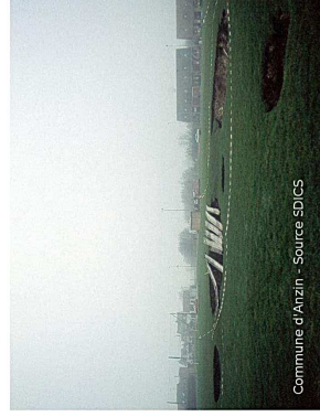
Commune d'Arzin