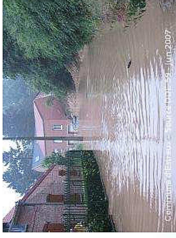
Communes de Leval - Juin 2007